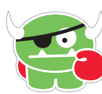
TARTAR THE TERRIBLE