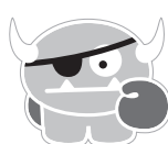
TARTAR THE TERRIBLE